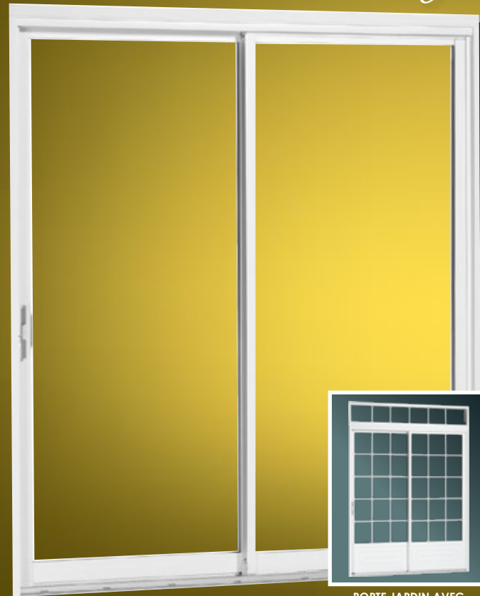
PORTE JARDIN AVEC CARRELAGES ET IMPOSTE